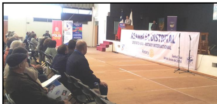
Foto del Salón Plenario que contó las asistencia de 267 rotarios de 47 clubes, que se realizó en el Colegio Santa Cruz de Unco, con un almuerzo en la casa Rotaria del R.C. Santa Cruz a quienes felicitamos pos su excelente organización.