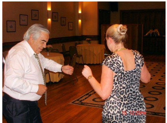
PROGRAMA MES DE DICIEMBRE Jueves 30: Compañerismo