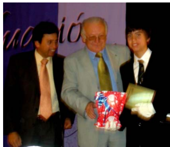
Entrega de regalos en Escuela “República de Costa Rica”