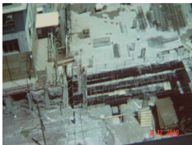
Estacionamientos subterráneos Plaza Ñuñoa, Santiago