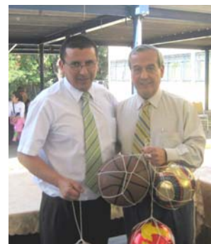
Entrega de galvanos y regalos en Escuela “Guardiamarina Zañartu”