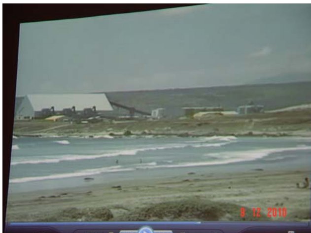
Terminal de carga marítimo Minera “Pelambres”