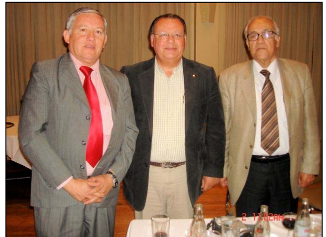
Presidente Propuesto, Presidente Electo y Tesorero