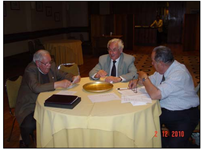
La Comisión Escrutadora en el recuento de votos