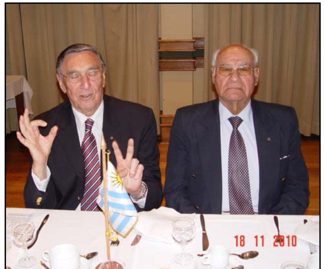
Chile 2 – Uruguay 0