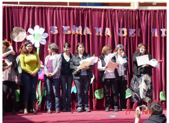
Escuela Especial “Exequiel González Cortés”