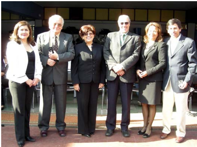
Escuela “República de Costa Rica”