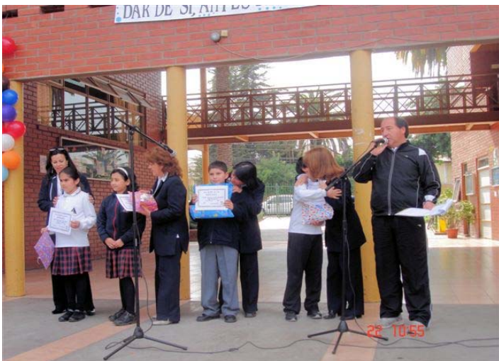
Escuela “República de Siria”