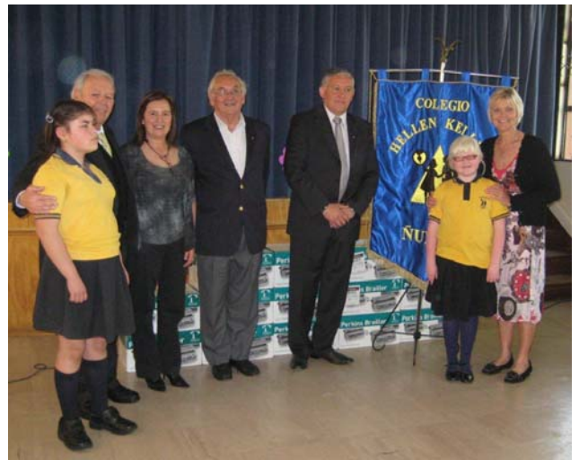
Entrega de máquinas Perkins-Braille a Escuela “Helen Keller”