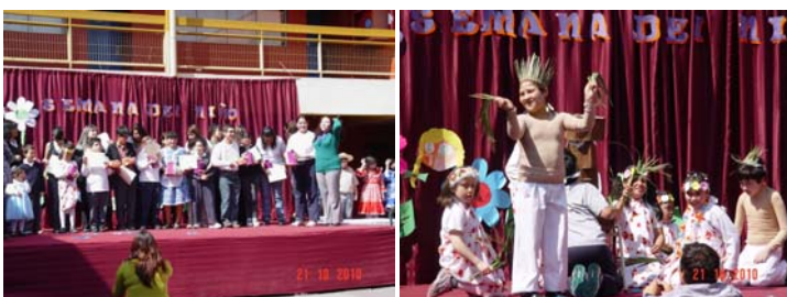
Escuela Especial “Exequiel González Cortés”