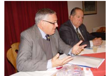
Exposición de Directores