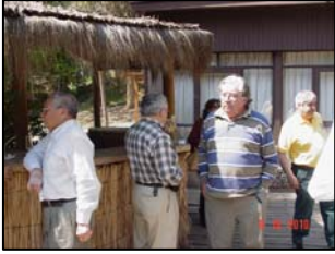
Los más viejos