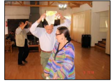
Esta es cueca, mi alma....