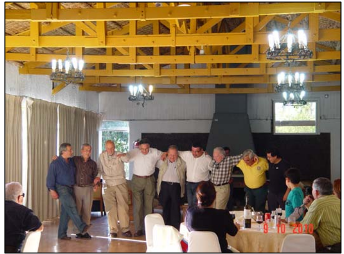
“Sobra” el Griego....