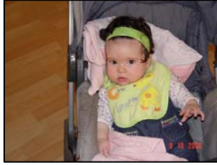
La más joven