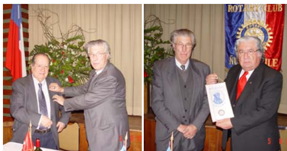
Cambio de insignias Secretarios-Banderín de Club de Bélgica