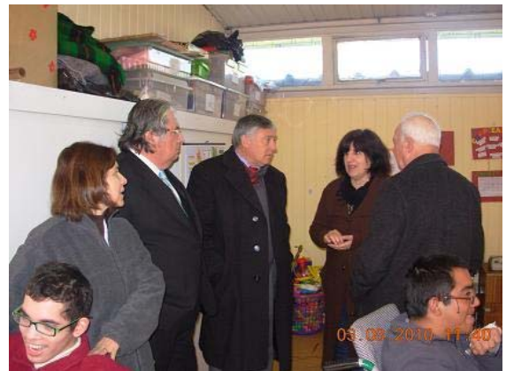
Otra vista de la visita a la Escuela para no-videntes