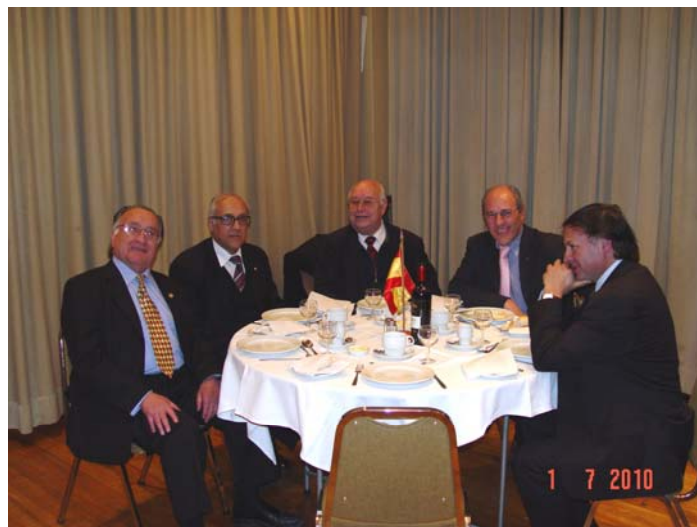
Grata convivencia rotaria