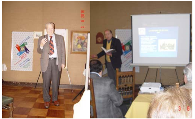
Expositores de la Jornada