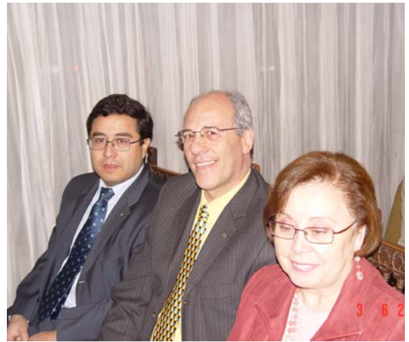
Asistentes a las Jornadas de Instrucción Rotaria