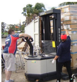
Rotarios del Distrito 9750 (Australia) cargan suministros para su envío a Chile.