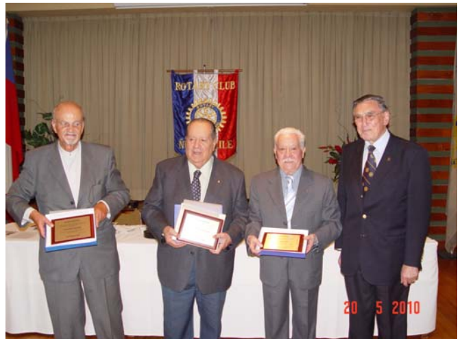
Los galardonados por años de servicios