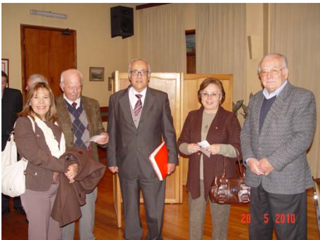
Durante el cóctel de Aniversario