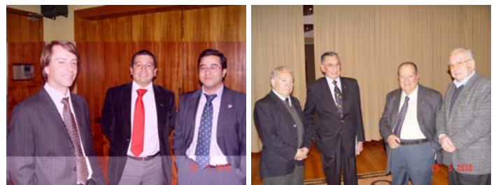
La juventud y .....la experiencia