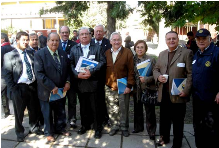
Grupo de Trabajo de R. C. Ñuñoa