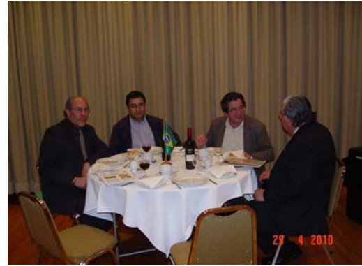
Una grata tertulia....