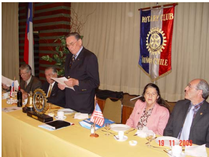
Mesa de Honor