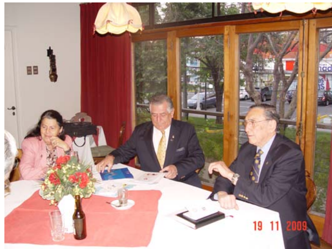
Reunión de trabajo

A los postres, el Gobernador Carlos hizo uso de la palabra, para destacar su impresión sobre el Club, con palabras de reconocimiento, aliento y también indicar que la tarea trazada a principios del período debe llevarse a cabo en los términos que cada club ha establecido. En este sentido, destacó que Ñuñoa es un club distinto, además de serio y cumplidor para con la Gobernación. Sin embargo, la actual situación mundial, la que también ha afectado fuertemente a Rotary Internacional, hará que debamos redoblar nuestros esfuerzos para cumplir, no solo nuestras propias metas, sino, además, colaborar con la Fundación, en la medida de nuestras posibilidades.