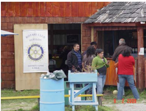
El Stand Rotario de Quellón