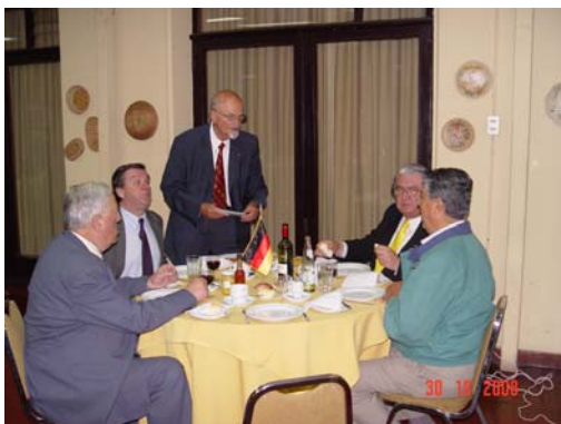
La mesa "alemana"