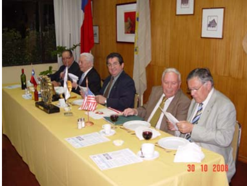
La Mesa de Honor