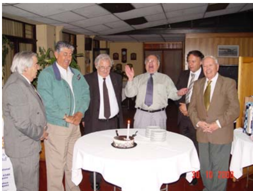
Los cumpleaños de turno