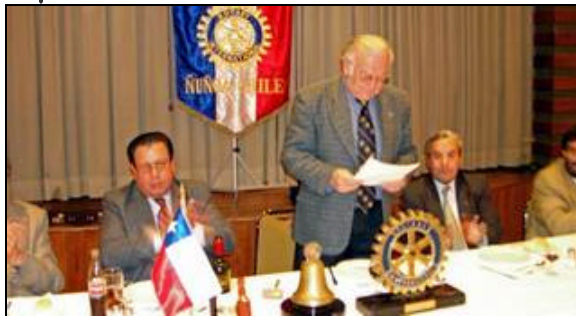
Sesión 2958 Histórica y 15 del Período. Jueves 11 de octubre de 2007