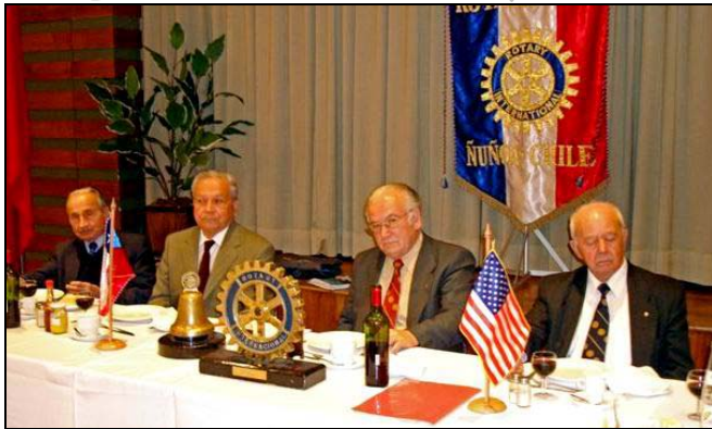
Sesión.2957 Histórica y 14 del Período Jueves 04 de octubre de 2007