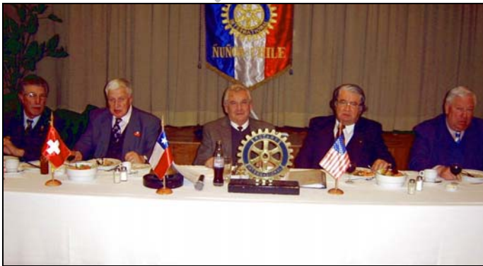
Sesión.2948 Histórica y 05 del Período Jueves 02 de agosto de 2007

En este mes y desde hace mucho años, mientras hemos sido huéspedes y socios del Club Suizo, Rotary Club Ñuñoa, rinde un sentido homenaje a la Confederación Suiza, en su mes aniversario N° 716