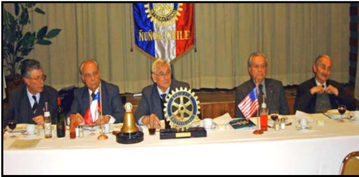
Sesión.2946 Histórica y 03 del Período Jueves 19 de julio de 2007

Antes del inicio de la Sesión, las habituales prácticas deportivas de mesa y la grata conversación entre los rotarios, nos transformamos en entusiastas hinchas del fútbol para ver el partido de semifinales de la Copa Mundial Sub-20 en Canadá, donde la "Rojita" cayó en forma estrepitosa ante la escuadra Argentina.