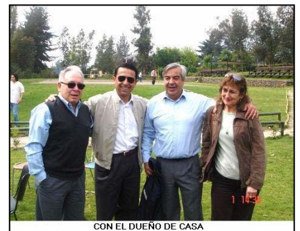
CON EL DUEÑO DE CASA