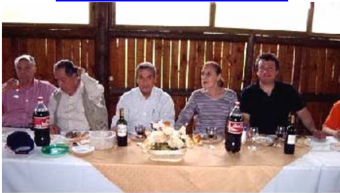
LA MESA DE HONOR

Sesión 2.861 Histórica y 14 del Período Sábado 01 de Octubre del 2005