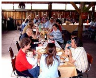
DISFRUTANDO EN FAMILIA